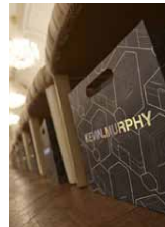
Kevin Murphy Session Spray gav modellerne hår glans og stærkt hold. Til de heldige publikummer var der lækre goodie-bags fra Kevin Murphy.