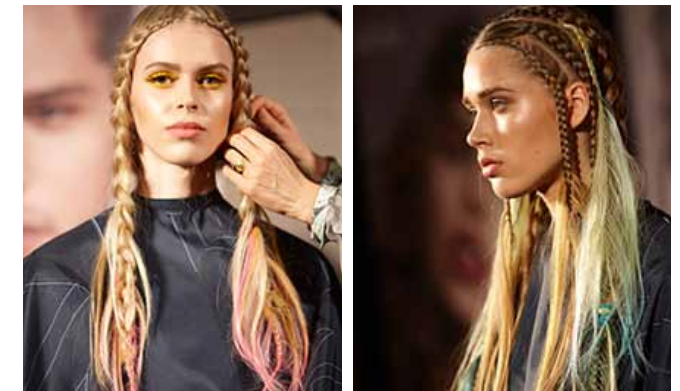
De to looks 'hætteflet' (tv.) og 'påfugleflet' (th.) blev introduceret i løbet af aftenen.