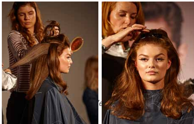
Det lolita-inspirerede glam look blev brugt under Birger Christensens modeshow da det stod i fin kontrast til de dyre pelse.