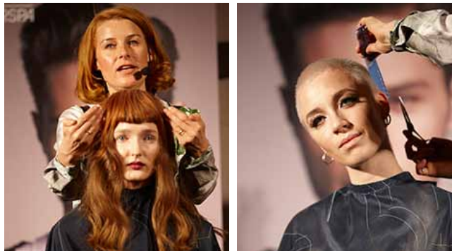
Frisørerne blev introduceret for 'Micro Bang' looket (tv.) og 'The Buzz Cut' looket (th.).